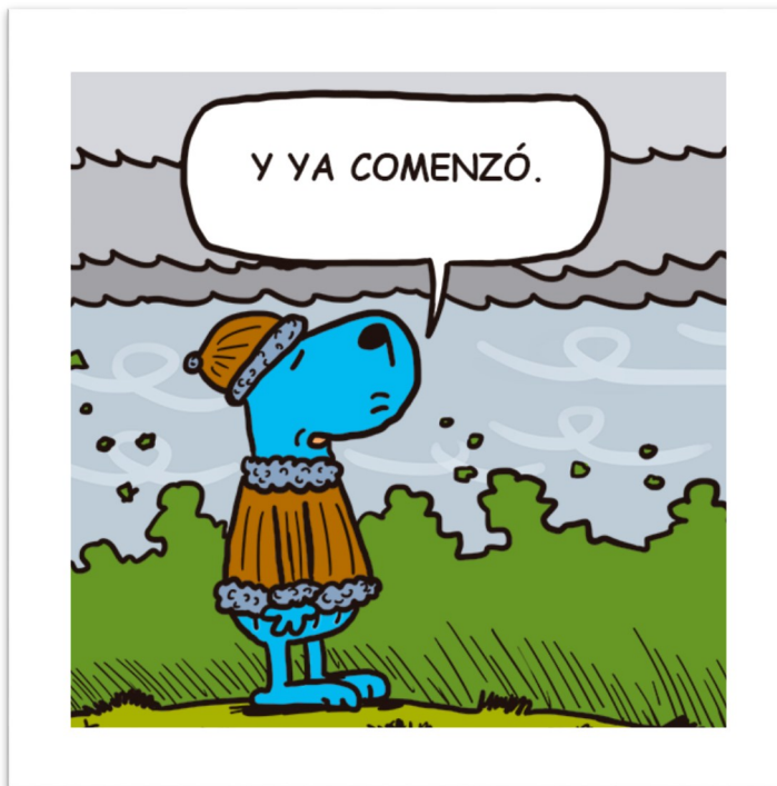
▲ Ronsoco Azul, de Carlos Cavero